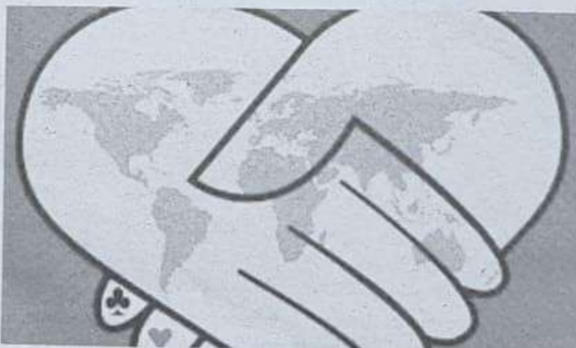
Ça sera un moment historique au Maroc pour la paix et le sport.

Marrakech et ce, du 20 août au 2 septembre 2023 où pas moins de 1.200 joueurs et joueuses représenteront les 46 pays qualifiés à cette importante manifestation.